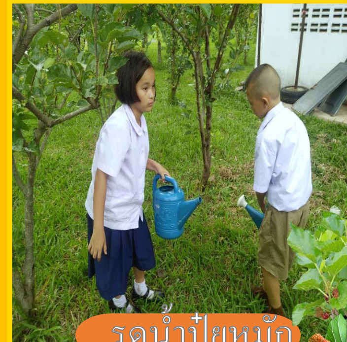
รดน้ำปุ๋ยหมัก